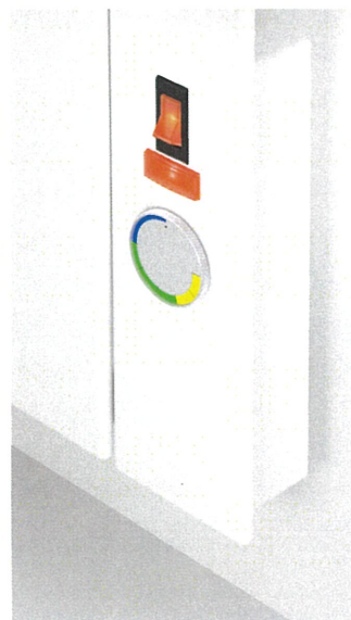
従来型操作部正面タイプ外観